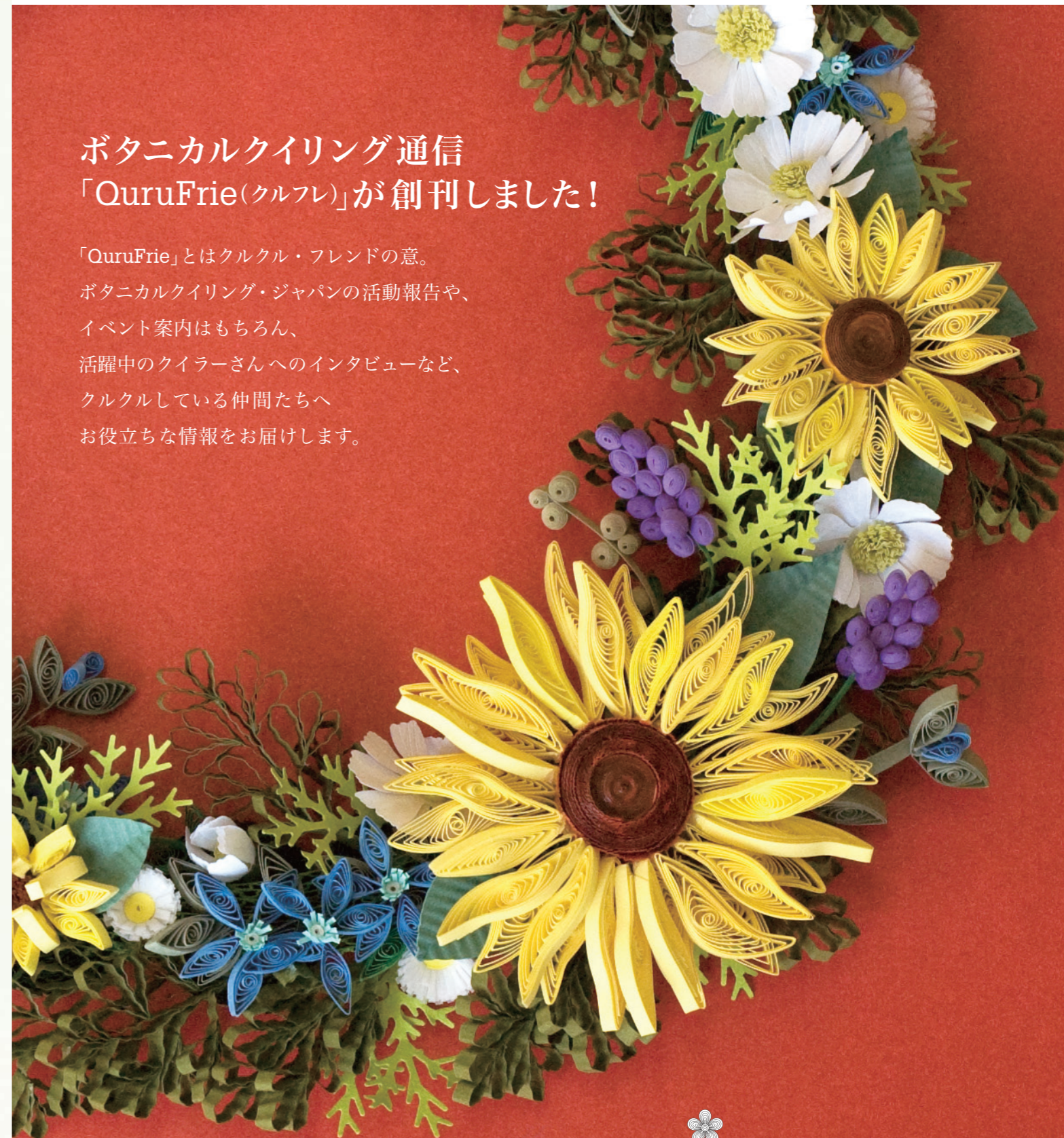
Featured Art : by なかたにもとこ「初夏のリース」

ボタニカルクイリング・ジャパンの活動報告や、イベント案内はもちろん、活躍中のクイラーさんへのインタビューなど、クルクルしている仲間たちへお役立ちな情報をお届けします。