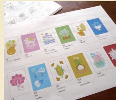
千趣会さんに提出した最初のラフ。この中で生き残ったのは5柄のみ。でも泣かない。

ちょっと前の話ですが、千趣会の手芸カタログ「くららぼ」で、クイリング・カレンダーのキットを制作しました。全部で12柄あって、毎月1柄ずつ届く初心者向けのキットです。初心者向けって、実はデザインするのが難しいのです。「初心者向けのキット」とは、言い換えてみれば「初心者さんが「私でも作れそう〜」と思えるキット」なんです。マーキーズやティアードロップ自体が「作れそう〜」と思えるほど簡単なものでは気が…。だからできるだけ大きめのパーツで単純な構図にしようと思うのですが、これがなかなか格好つかない。「作れそう〜」以前に「作りたい〜」って思って頂かなくては元も功もないのです。ペーパーは市販のものに限られるので、色の選択幅が限られるし、先方のご意見(どんでんがえし有り)もあるし…。キット作りには数々の試練が待っているのです。そんな難関を乗り越え、世に出たキット。「好評ですよ〜」との声を聞いて、そこでようやく「あ、これでよかったんだ」と落ち着けます。ハイ。