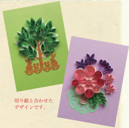
切り紙と合わせたデザインです。