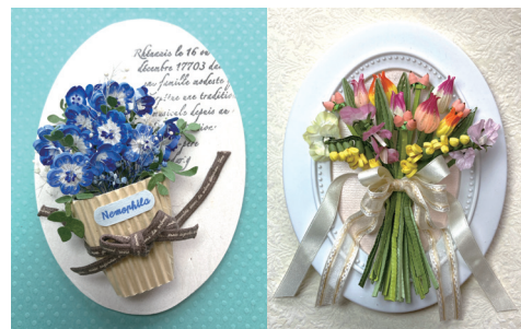
キット用に制作したオリジナル作品