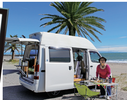
ランチキャンプでリフレッシュ!