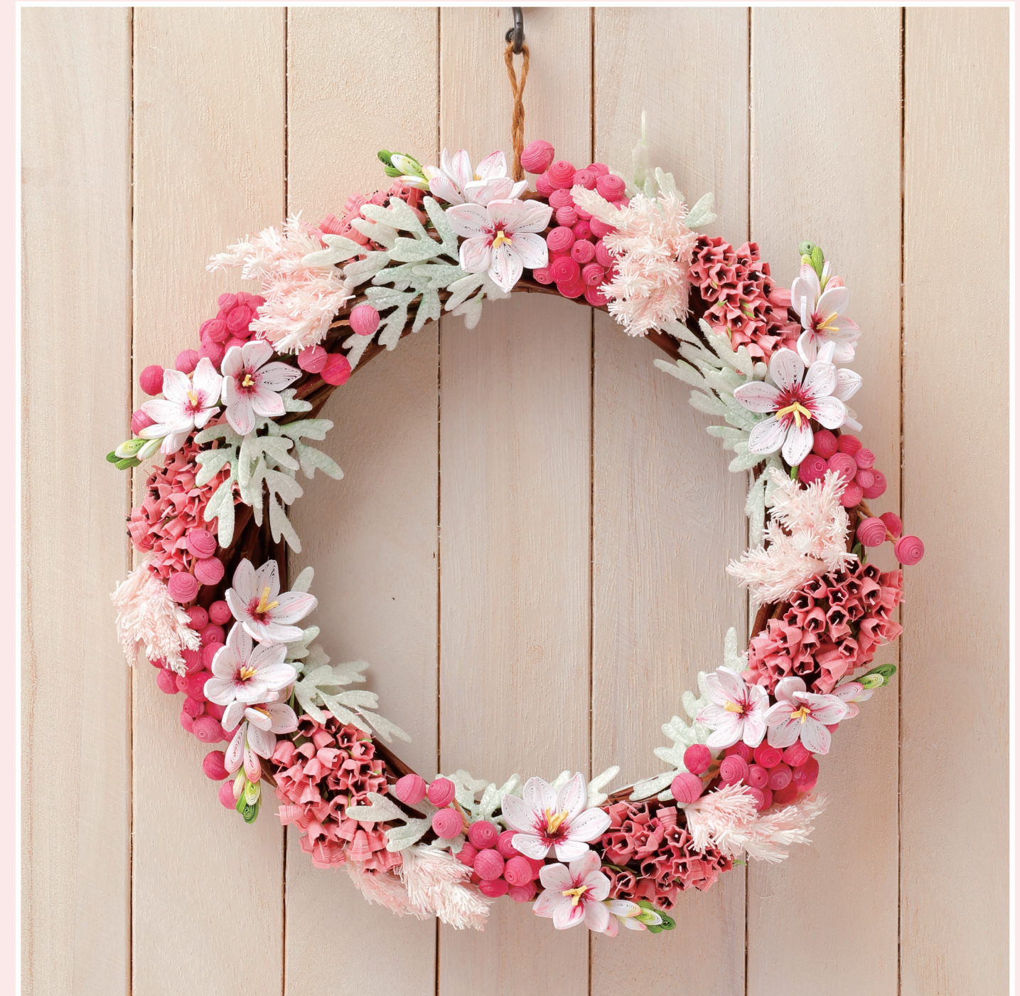
あこうのぶこ「春を待つリース」